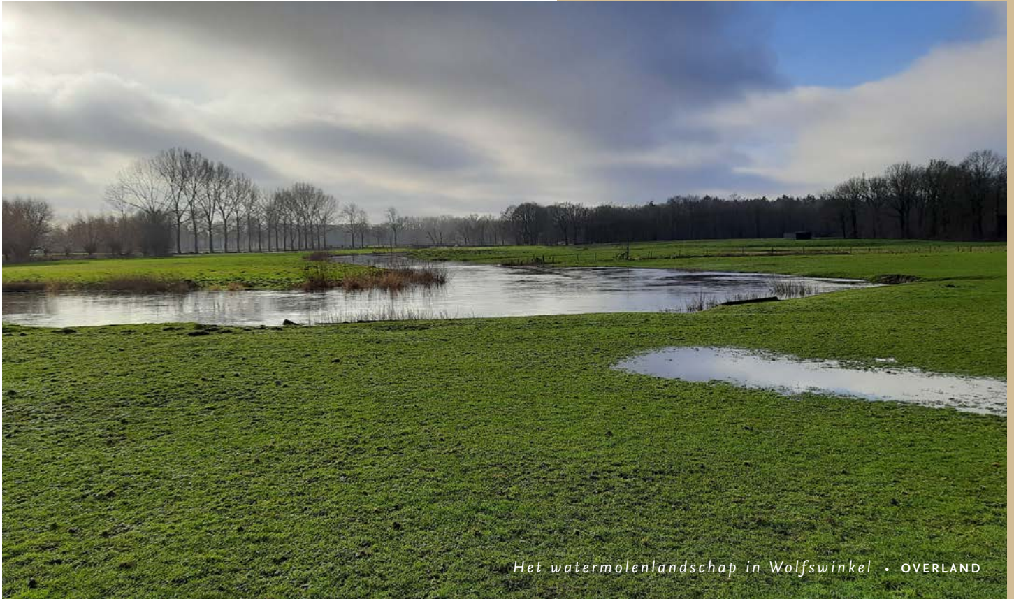
Het watermolenlandschap in Wolfswinkel • OVERLAND