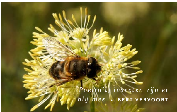
Poelruit, insecten zijn er blij mee • BERT VERVOORT