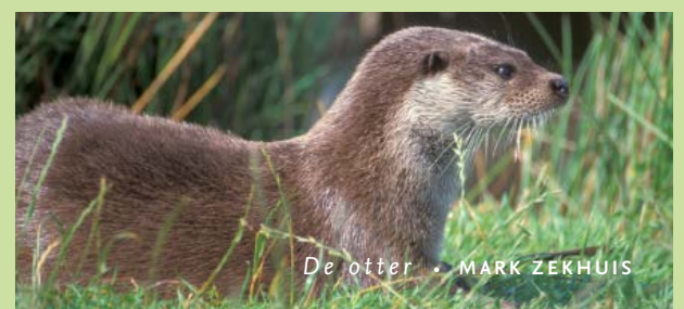
De otter

Samen met Staatsbosbeheer en Brabants Landschap maakt ARK zich sterk voor de otter. We gaan veilige verbindingen, natuurlijke oevers en beboste schuilplekken creëren om het dier in het Dommeldal te kunnen verwelkomen. Want die kans is er nu de populatie stevig groeit. Bijzonder, want de otter stond al bijna veertig jaar op de Rode lijst van zeldzame soorten. Maar de opmars is op gang gekomen: op dit moment leven er naar schatting zo'n 450 otters in Nederland, met dank aan herintroductie en schonere beken en rivieren. Om dit succesverhaal te vieren en aandacht te vragen voor verdere bescherming riep de Zoogdiervereniging 2021 uit tot het Jaar van de Otter.