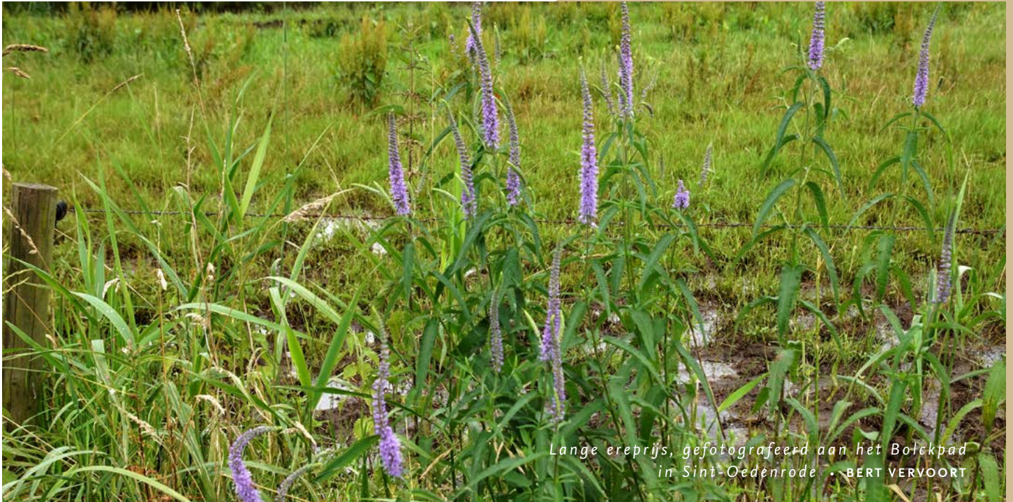
Lange ereprijs, gefotografeerd aan het Bofekpad in Sint-Oedenrode