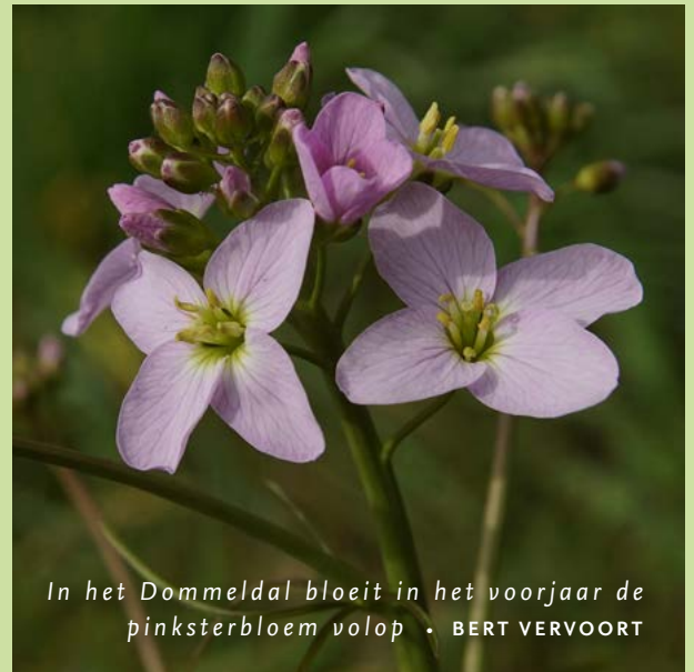
In het Dommeldal bloeit in het voorjaar de pinksterbloem volop

“Wij buigen ons als waterschap over waterkwaliteit, waterstanden in beken en sloten, grondwaterstanden maar ook over het opvangen van de gevolgen van klimaatverandering. Vragen als ‘Hoe gaan we om met veel water tijdens piekbuien en het watertekort in de zomer?’ liggen standaard op ons bordje. Eenvoudige antwoorden zijn er niet. In het beekstelsel van de Dommel hangt ‘alles met alles’ samen: de beek ontspringt in België en stroomt naar het noorden, waarbij steeds meer beken en water samen komen richting 's-Hertogenbosch. Wat bovenstrooms gebeurt, heeft invloed op benedenstrooms en andersom. Als we bijvoorbeeld in de beneden-Dommel het water niet kunnen afvoeren, stuwt het stroomopwaarts of in zijbeken op. We moeten dus heel goed onderzoeken welke oplossingen we inzetten.”