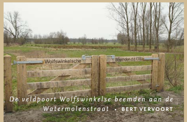
De veldpoort Wolfswinkelse beemden aan de Watermolenstraat • BERT VERVOORT

Het herstellen van deze landschappen kan bijdragen aan klimaatoplossingen én zorgen voor een kwaliteitsimpuls van de leefomgeving. Molenstichting Noord-Brabant, Provincie Noord-Brabant en Waterschap de Dommel spannen zich daar met het Erfgoed Deal-programma voor in. In Wolfswinkel werken ze daarbij samen met andere partners. Zo ontwikkelt het Kadaster een geocache voor het gebied, komt er binnenkort een podcast over Wolfswinkel online en organiseren ARK en Staatsbosbeheer een ontwerpatelier. Tijdens de Landschapstriënnale 2021 in april worden deze initiatieven nader belicht in de Landschapslaboratoria Brabantse Beken en Datascales.