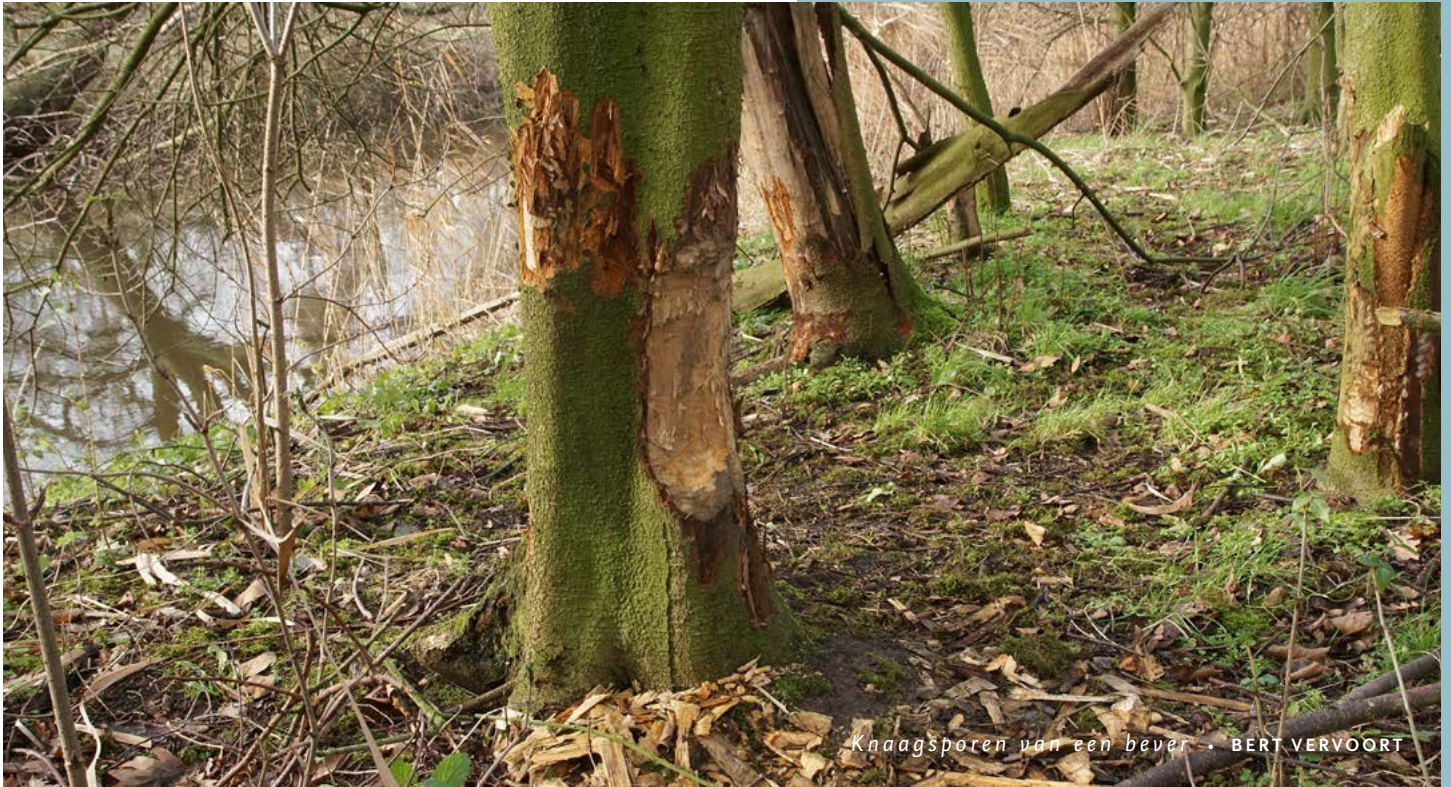
Knaagsporen van een bever • BERT VERVOORT