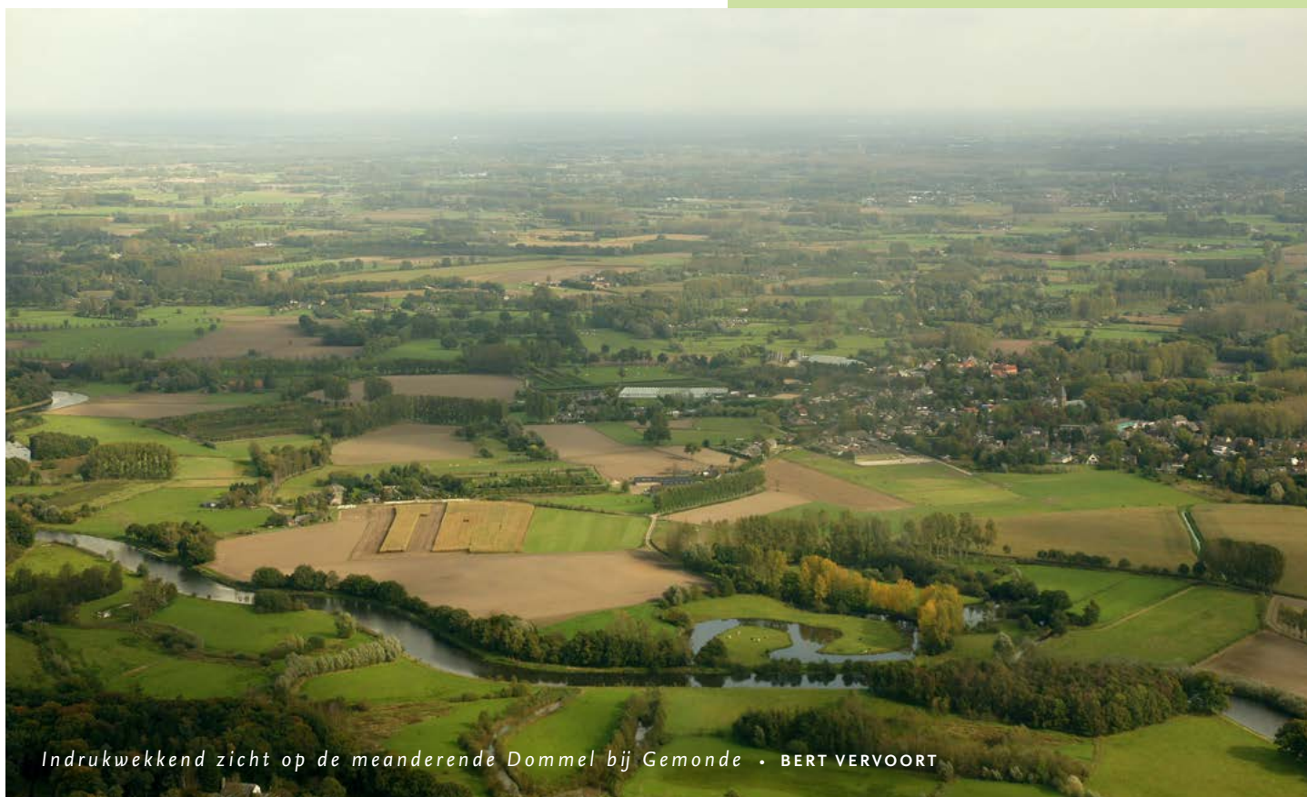
Indrukwekkend zicht op de meanderende Dommel bij Gemonde • BERT VERVOORT