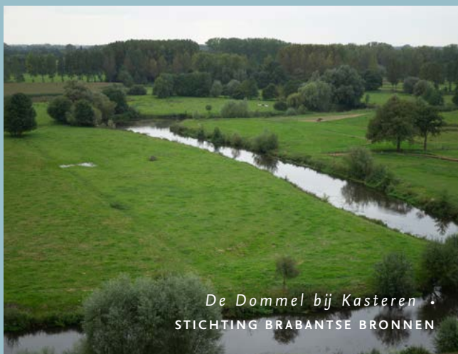
De Dommel bij Kasteren STICHTING BRABANTSE BRONNEN

Om het Natuurnetwerk Brabant te realiseren, verwerft ARK gronden in Het Groene Woud. Dat doen we in het kader van het project Brabants Goud in Het Groene Woud. Eind maart 2021 beschikten we over circa 250 hectare grond, waarvan een deel in het Dommeldal ligt. Onze methode: we verwerven, zorgen voor de inrichting en het tijdelijk beheer. Na enkele jaren dragen we de gronden over aan andere beheerders. Onze meest recente Brabants Goud-aankoop: een perceel aan de Watermolenstraat in Nijnsel.